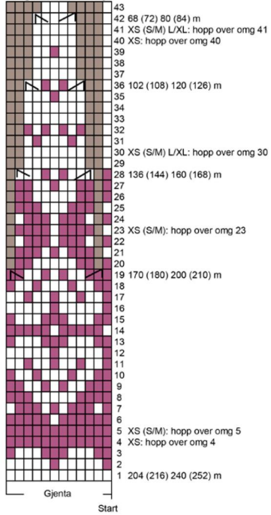
Diagram 2 - Bærestykke